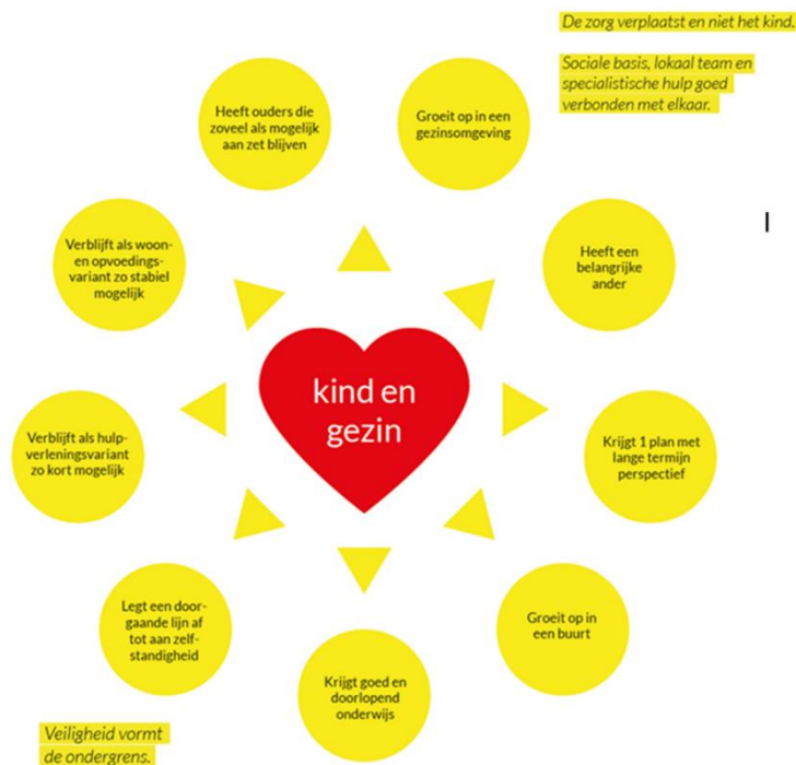
Figuur 1: De bollenplaat